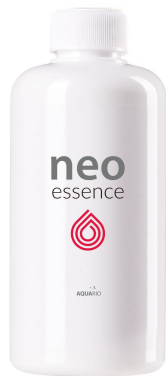
NEO Essence 300mL

Función principal: Promover la fotosíntesis de las plantas logrando una mejora en el color de las mismas así como en la tasa de crecimiento.