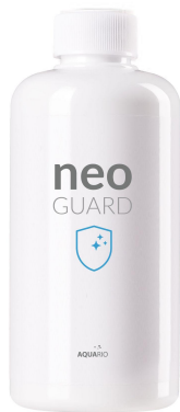
NEO Guard 300mL

Función principal: Reducción de los niveles de fosfato (PO 4 ) presentes en el acuario.