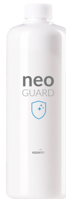
NEO Guard 1000mL