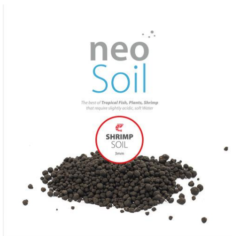
NEO SOIL SHRIMP

Función principal: Servir como sustrato nutritivo para gambas o bien para acuarios plantados de exigencias medias o bajas.